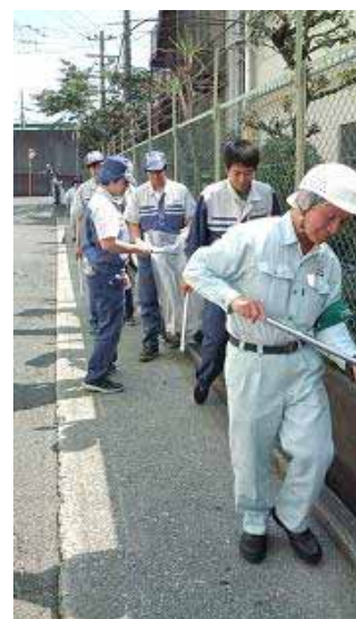
(工場周辺の清掃活動)