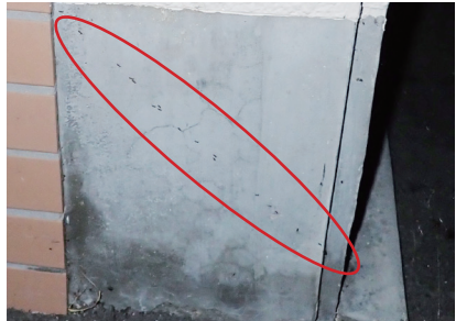
夜、マンションの2階まで続く行列