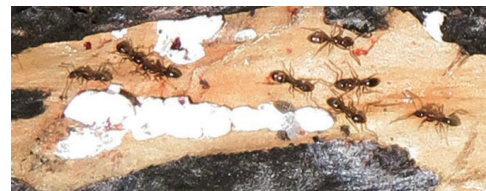
カイガラムシを保護するアルゼンチンアリ