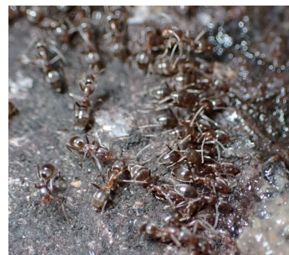
あっという間に食べ物に群がります