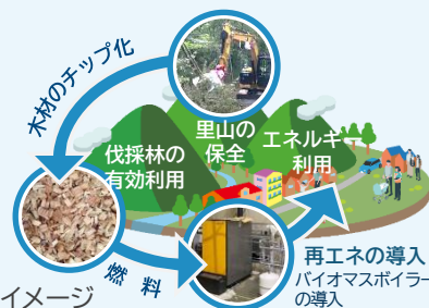
北摂地域循環共生圏イメージ