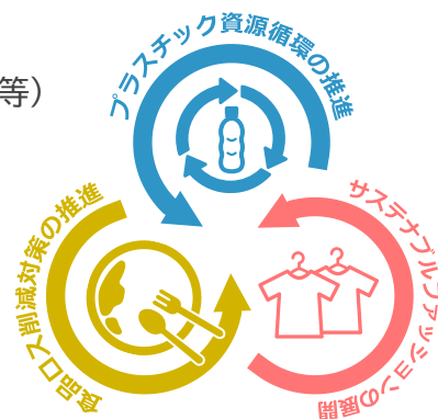
暮らしに根ざした資源循環の重点取組