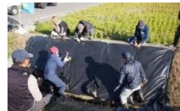
ナガエツルノゲイトウ防除作業