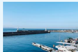
明石港から望む瀬戸内海