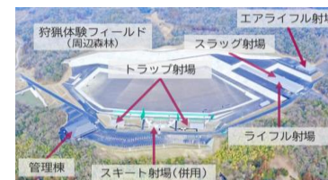
兵庫県立総合射撃場