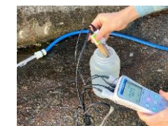
地下水の採取・測定