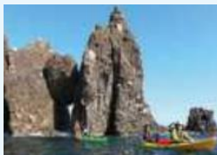
山陰海岸ジオパーク