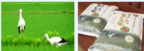
コウノトリ育む農法