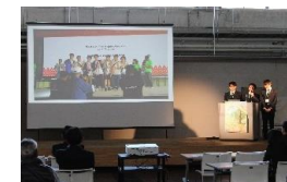
ひょうごユースecoフォーラム