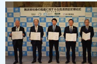
脱炭素社会の推進に関する包括連携協定締結式