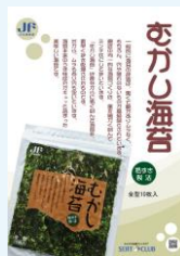
「カーボン・ゼロのり」のブランディング