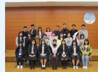
ひょうご高校生環境・未来リーダー育成プロジェクト