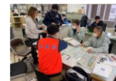
R6年能登半島地震への支援(珠洲市)