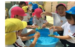
ふるさと兵庫こども環境体験