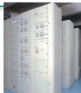
▲コントロール設備