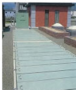
▲上澄水排出装置(上部)