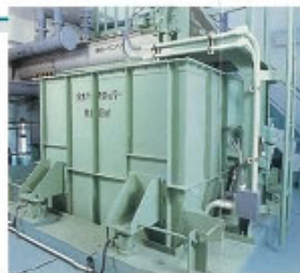
▲乾水ケーキホッパー