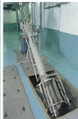
▲自動様目スクリーン