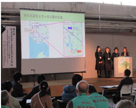
活動発表（明石北高校）

ソメイヨシノなどのバラ科の植物に被害を及ぼす特定外来生物クビアカツヤカミキリの分布拡大阻止に向けて、昨年度は、樹木医と連携して、成虫や幼虫の調査を実施。今年度は企業と協働して調査を行い、GISを用いたソメイヨシノのデジタルマップを作成した。