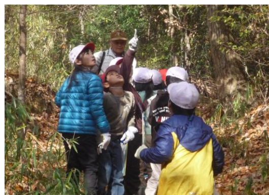
環境体験事業における里山での活動（三木市）

このほか、「環境教育実践発表大会」を実施し、先進校の実践事例発表や講演を通して、環境教育推進の成果や課題等についての情報交換を行うほか、特色ある優れた実践を行っている学校をグリーンスクールとして表彰し、活動内容等の普及を図っている。