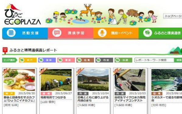
ふるさと環境通信員レポート

「ふるさと環境通信員」は、若者の視点で環境に関わる優れた実践活動や次世代に残したい貴重な地域資源等の取材・発信を通して、ふるさと意識の醸成や地域資源を生かした自発的な実践活動への参画の契機となる取組を展開している。