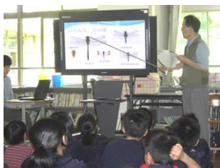
豊岡市立城崎小学校 ヒメイトトンボの生息環境調査

豊岡市立城崎小学校（平成27年度グリーンスクール表彰校）では、小学校の児童会と地域自治会、中学校の生徒会がタイアップし、「城崎プロジェクトC」と称して、3者合同の地域クリーン作戦を実施している。また、ラムサール条約認定湿地である「戸島湿地」が学校の近くにあるため、コウノトリの生息環境を中心とした戸島湿地の保全活動を行うとともに、絶滅危惧種であるヒメイトトンボの生息環境調査等、学年の発達段階に応じた取組を計画的、継続的に実施している。