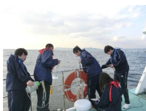
県立尼崎小田高等学校 「調査船による水質調査」

県立尼崎小田高等学校（平成 25 年度グリーンスクール表彰校）では、大学や地域との連携事業を取り入れ、地元港、尼崎運河の環境調査と実験に取り組む機会を多く設けるほか、「瀬戸内海の環境を考える高校生フォーラム」を生徒自らが企画運営を行い、他の高等学校や大学、行政機関等と連携して実施するなど、生徒の研究内容を整理する力や発表力を育成するだけでなく、課題研究の成果を地域に還元している。