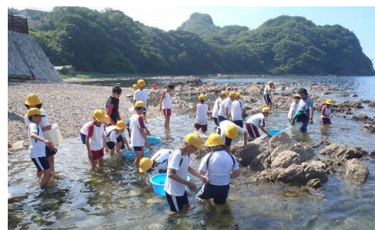
自然学校における水辺での活動（竹野海岸）