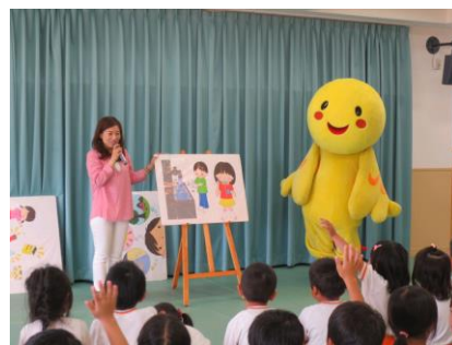
はばタンの環境学習

平成18年度から実施しており、これまでに10,000人（平成27年3月末現在）を超える園児が参加している。