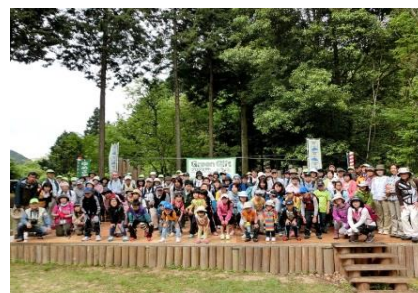
「企業の森」活動（ゆめさきの森公園）

平成 26 年度末で 27 の企業や団体と活動協定を締結し、森づくりを推進している。