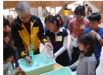
地球工房での CO 2 発生実験の様子