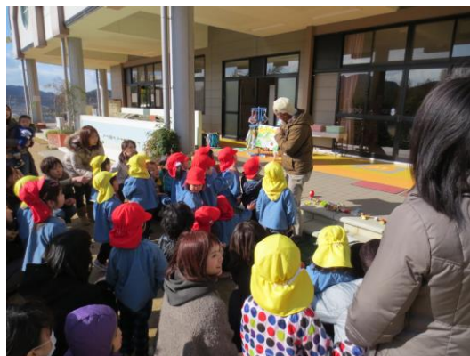
グリーンサポーターによる環境学習風景(相生市)

また、ふるさとへの関心・愛着が地域の環境の保全・創造に向けた活動の原動力となるとの視点から、平成26年度に、ふるさとの自然環境の現状と課題を改めて地域住民とともに考える「ふるさと環境交流会」を県内7カ所で開催するとともに、若者による環境づくり活動の発表と交流の場として、平成26年度に「ひょうごふるさと環境フォーラム2014」を開催し、県内9大学の協力を得て募集した15名の学生スタッフが企画、運営し、県内で環境に関わる活動に取り組んでいる34団体からの活動事例発表をもとに、「明日につなぐふるさとひょうごの環境を考える」をテーマに議論を行った。