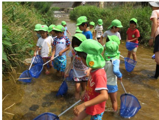
ひょうごエコっこ育成事業における河川での活動（神戸市）

平成19年度から24年度にかけて実施した「グリーンガーデン実践事業」「グリーンガーデンサポート事業」により、乳幼児期の体験型環境学習・教育の全県展開を図るとともに、平成26年度から27年度にかけて実施した「ひょうごエコっこ育成事業」では、モデル園における取組に加えて実践発表会等の実施により成果の共有を図っている。