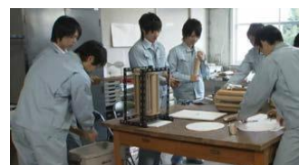
県立洲本実業高等学校 「クロスフロー風車作り」

また、県立洲本実業高等学校（平成 26 年度グリーンスクール表彰校）では、地域との共同研究会を立ち上げ、微風でも起動できる風車（クロスフロー風車）を開発し、街路灯を設置するなど、持続可能な地域づくりをめざす「あわじ環境未来島構想」の推進に寄与する取組を行っている。