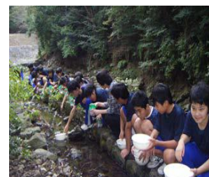
南あわじ市立三原中学校 「幼虫放流会」

また、南あわじ市立三原中学校（平成26年度グリーンスクール表彰校）では、理科部員が中心となって“ホタルの里”の復活をめざし、蛍の人工飼育・放流活動を継承し、産卵箱等の準備から幼虫放流と観察を続けながら蛍の飼育を行っている。また、地域住民を光と幻想の世界に誘う「観蛍会」を開催することで、環境保全を啓発し、地域コミュニティづくりにも寄与している。