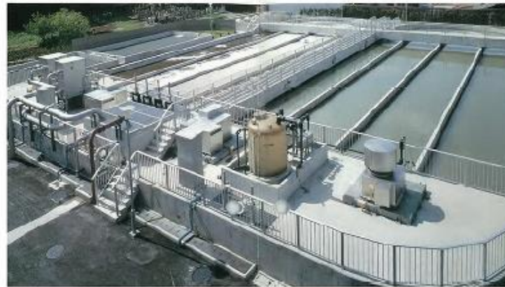
オムゲンブーレンディック