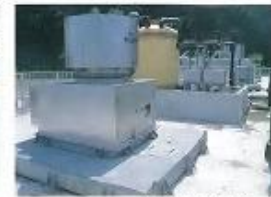
塩素瓶(ホローセルエアータ)