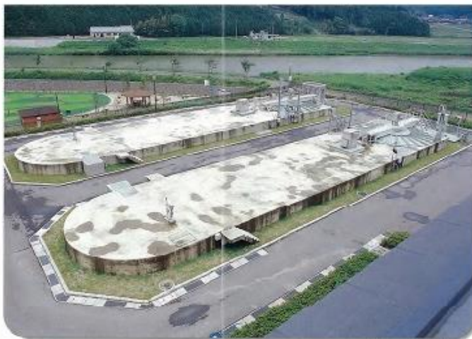
オキシデーションディッチ