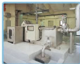
スクリーンユニット