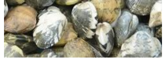
個体によって模様が違うアサリ