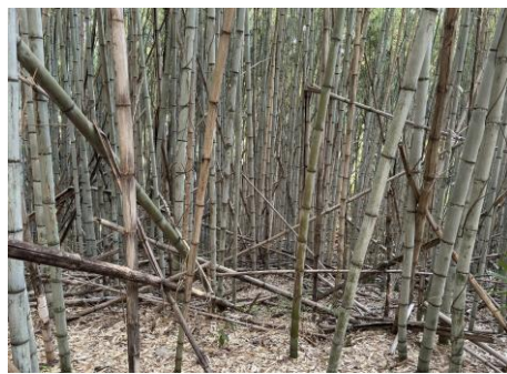
放置竹林の拡大により生態系への悪影響や土砂災害の危険が懸念