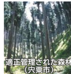
適正管理された森林 (宍粟市)