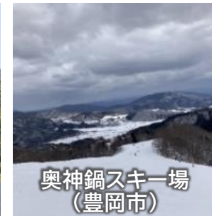
奥神鍋スキー場 (豊岡市)