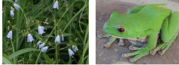
ツリガネニンジン（新温泉町） シュレーゲルアオガエル（たつの市）