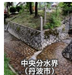
中央分水界 (丹波市)