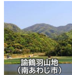
諭鶴羽山地 (南あわじ市)