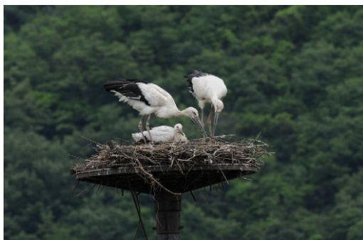
生息環境の変化により1971年に一度野生絶滅したコウノトリ