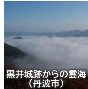
黒井城跡からの雲海 (丹波市)