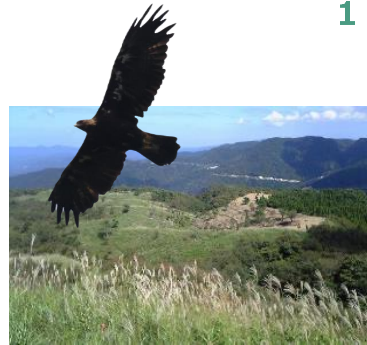
豊かな生態系が息づく上山高原とイヌワシ

兵庫の豊かな生態系を未来に引き継ぐため、私たち一人ひとりが生物多様性について正しく理解して主体的に行動していけるよう、当戦略に基づき、本県では、県民の皆さんや市町、地域団体、企業、教育・研究機関など多様な主体と緊密に連携して取組を進めます。