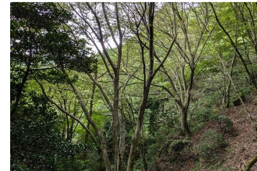
気候変動により冷温帯林であるブナ林の生息適地の縮小が懸念