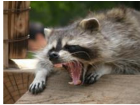
農作物被害や在来生物の捕食により生態系に影響を及ぼすアライグマ