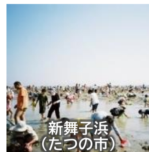
新舞子浜 (たつの市)