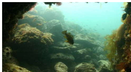
防波堤基部に用いた石材に集まるメバル

防波堤や物揚場等の整備、補修、更新時には、環境配慮型構造物の採用に努め、周辺水域における良好な生物生育環境の向上、創造を推進する。