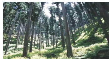
間伐など適正に管理された人工林 (木は太く成長、下草も繁茂)

森林は、木材生産機能のみならず、水源の涵養、保健・レクリエーション、土砂災害・洪水の防止などの多面的機能を有している。