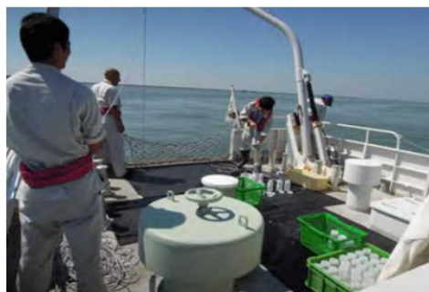
常時監視(海域)の様子

河川や海域等の水環境の状態を把握し、施策に反映するため、国や市町と連携し、水質汚濁防止法に基づき策定した「公共用水域及び地下水の水質測定計画」に基づき、水質測定を継続的に行う。