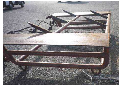
小型漁船による海底耕耘 (右:海底耕耘に用いる桁)

海底の砂や泥が固まると、生物の生息環境悪化を招くことから、鉄製の爪のついた道具を漁船で曳航するなどの方法により海底を耕し、底質環境の改善を図る。