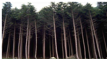
手入れ不足の人工林 (“モヤシ”のように混み合い、林内は薄暗い)