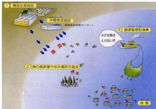
姫路市ホームページより