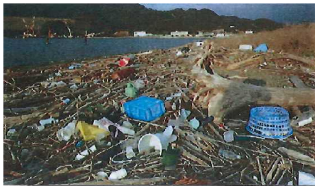
漂着したごみや流木