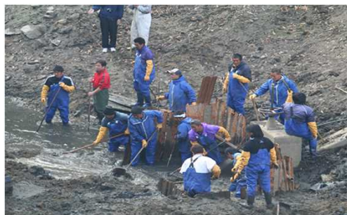
かいぼり（ため池の池干し）の様子

海域の貧栄養化の対策として、栄養分を豊富に含むため池の水を放流する「かいぼり」を漁業者と農業者が連携して行っている。