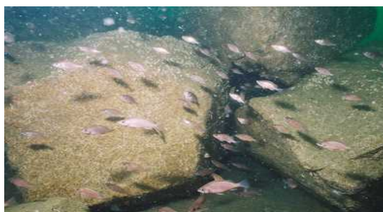
石材礁近くの魚の群れ

漁業生産の安定をめざし、海域ごとの主要魚種を対象に産卵親魚の保護、稚魚の育成の場となる増殖場や魚介類の生息域を拡大する魚礁漁場の整備を積極的に推進する。