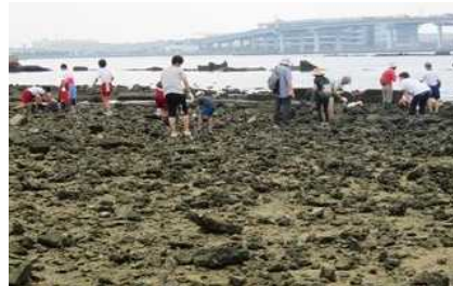
住民による藻場・干潟保全活動の様子

多くの人々が豊かな海づくり活動に関わっていく気運の醸成及び水質保全、生物多様性・生物生産性の改善を図り、地域の多様な主体による瀬戸内海沿岸域の環境保全、再生等の取組を支援する。