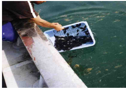
ヒラメ放流の様子

水産資源の維持増大のため、県栽培漁業センター等でマダイ、ヒラメ等の種苗を生産し、増殖場など生息適地への放流による効果的な栽培漁業を推進している。 また、新規魚種として、キジハタ、カサゴ、アサリ等の種苗生産に取り組んでいる。