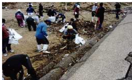
海岸漂着物の清掃活動

海岸漂着物対策として、海岸での回収・処理事業を実施するとともに、発生抑制対策として内陸部での清掃活動も進める。