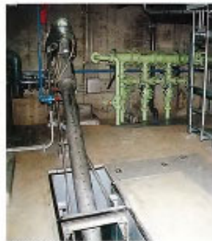
▲300口径汚水ポンプ井