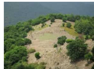
シカの食害により裸地化した森林（洲本市）

シカ・イノシシなどによる下層植生の衰退や農作物被害に加え、人里での出没が相次ぐツキノワグマやサルによる人身事故や生活被害が発生しており、野生動物の適切な個体数管理が必要