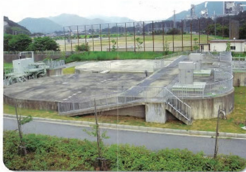
オキシデーションディッチ