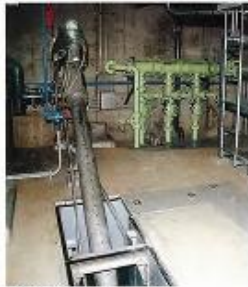
▲入り口・汚水ポンプ井