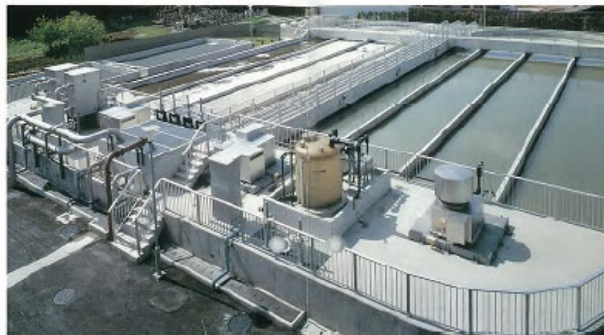
オキシゲーションディック