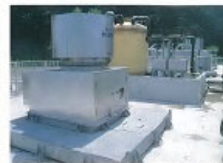
曝気機(カローセルエアレータ)