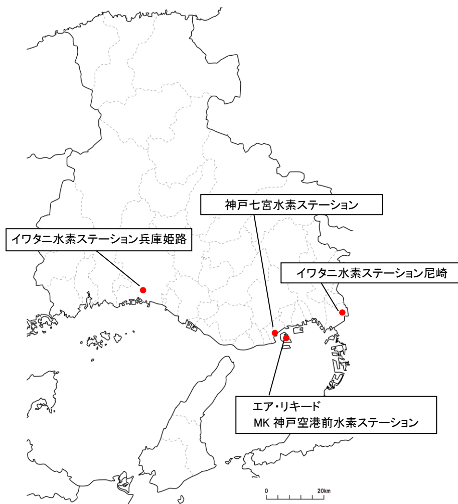
図4-1 水素ステーションの設置状況（令和5年5月末現在）

また、県は、令和7年までに県内10基以上の水素ステーションが整備されることを目指して、阪神、播磨、淡路地域などでニーズ把握を行い、合わせて事業者や県・市町等で構成する地域連絡会を設置し、整備適地の検討、市町補助の創設・拡充などを協議し、具体的な整備方策を検討する。