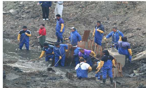
かいぼり（ため池の池干し）の様子

海域の貧栄養化の対策として、栄養分を豊富に含むため池の水を放流する「かいぼり」を漁業者と農業者が連携して行っている。