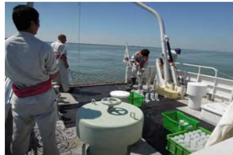
常時監視(海域)の様子

河川や海域等の水環境の状態を把握し、施策に反映するため、国や市町と連携し、水質汚濁防止法に基づき策定した「公共用水域及び地下水の水質測定計画」に基づき、水質測定を継続的に行う。