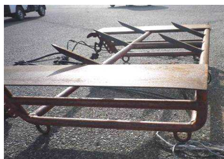
小型漁船による海底耕耘（右：海底耕耘に用いる桁）

海底の砂や泥が固まると、生物の生息環境悪化を招くことから、鉄製の爪のついた道具を漁船で曳航するなどの方法により海底を耕し、底質環境の改善を図る。