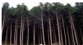
手入れ不足の人工林 (“モヤシ”のように混み合い、林内は薄暗い)