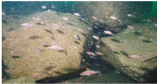
石材礁近くの魚の群れ

漁業生産の安定をめざし、海域ごとの主要魚種を対象に産卵親魚の保護、稚魚の育成の場となる増殖場や魚介類の生息域を拡大する魚礁漁場の整備を積極的に推進する。