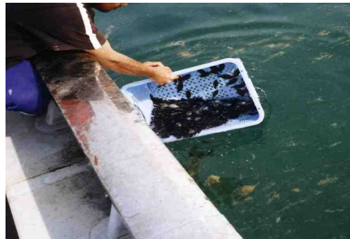
ヒラメ放流の様子

水産資源の維持増大のため、県栽培漁業センター等でマダイ、ヒラメ等の種苗を生産し、増殖場など生息適地への放流による効果的な栽培漁業を推進している。 また、新規魚種として、キジハタ、カサゴ、アサリ等の種苗生産に取り組んでいる。