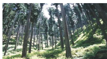
間伐など適正に管理された人工林 (木は太く成長、下草も繁茂)

森林は、木材生産機能のみならず、水源の涵養、保健・レクリエーション、土砂災害・洪水の防止などの多面的機能を有している。