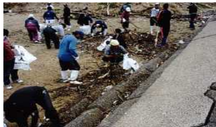
海岸漂着物の清掃活動

海岸漂着物対策として、海岸での回収・処理事業を実施するとともに、発生抑制対策として内陸部での清掃活動も進める。