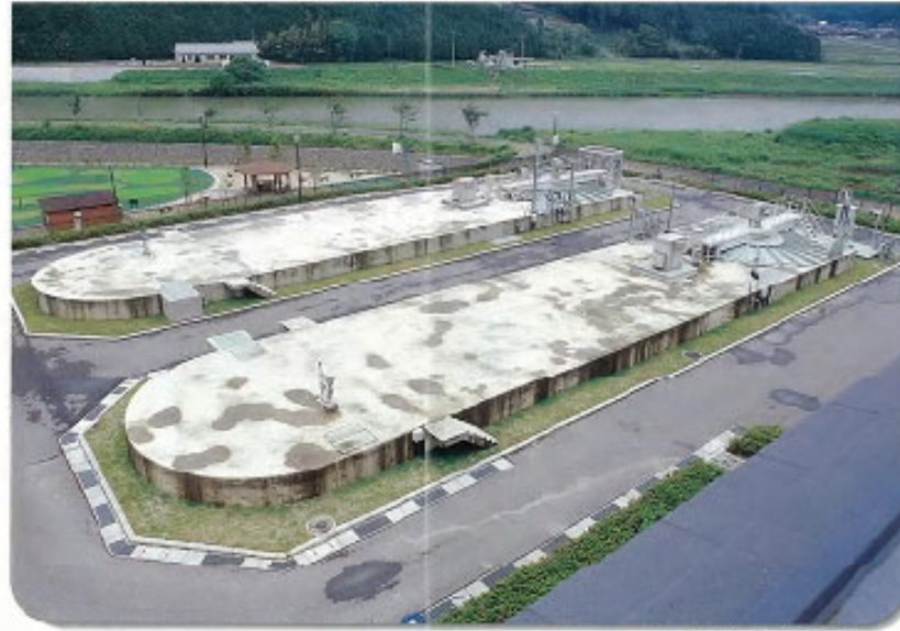
オキシデーションディッチ