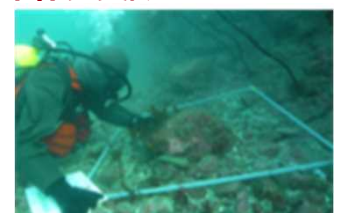
▲藻場の再生・創出の一例