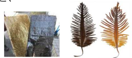
▲色落ちしたノリ（左側）・ワカメ（右側）

※ 栄養塩類の不足の他、気候変動による水温の上昇によって増加した大型の珪藻との栄養塩類を巡る競合も色落ちの一因。