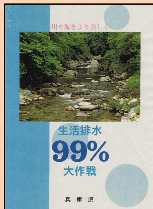
面向县内居民的科普教育手册