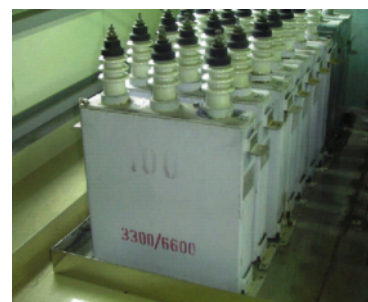
コンデンサ(蓄電器)