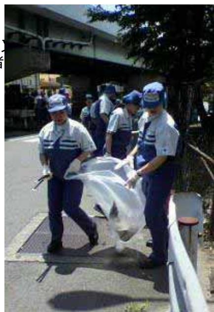
(工場周辺の清掃活動)