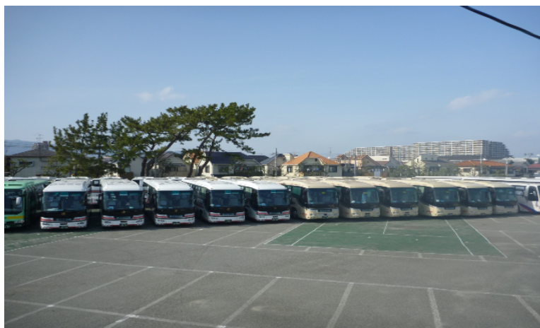
(甲子園浜駐車場に駐車する応援団バス 平成25年3月撮影)

( http://www.kankyo.pref.hyogo.lg.jp/JPN/apr/keikaku/diesel/diesel_kohshien.htm )