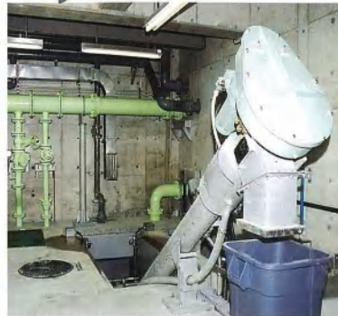
▲沈殿池・ポンプ井