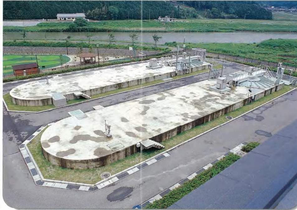
オキシデーションディッチ