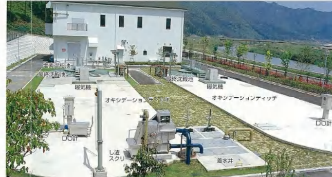
オキシデーションディッチ