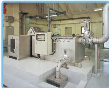
スクリーンユニット