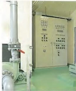
▲流入換気ファン室