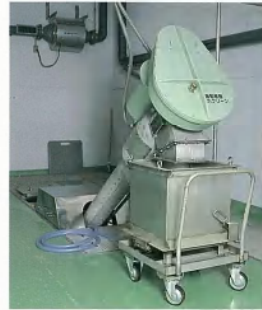
▲自動粗目スクリーン