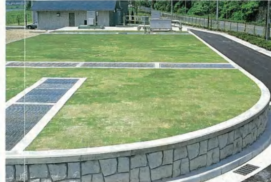
▲オキシデーションディッチ