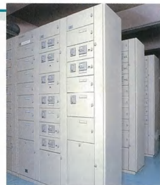
▲コントロール設備