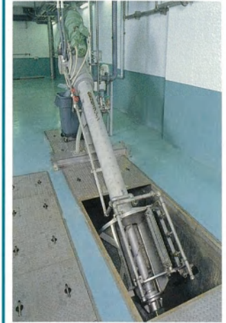
▲自動細目スクリーン