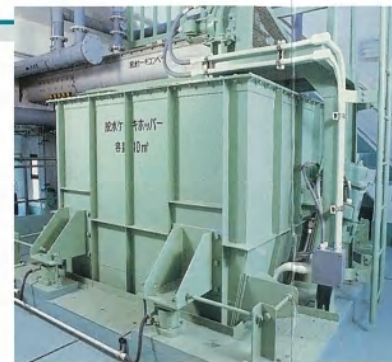
▲脱水ケーキホッパー