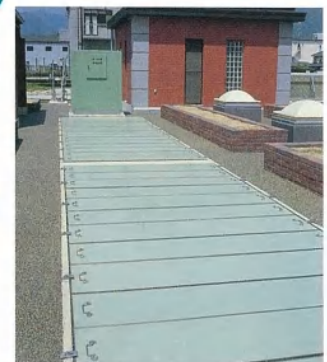
▲上澄水排出装置 (上部)