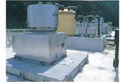
曝気機(カローセルエアレータ)