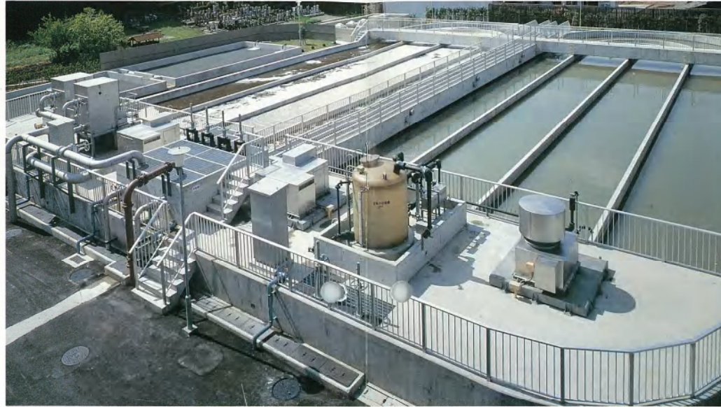
オキシデーションディッチ