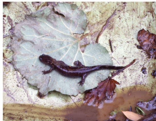
アベサンショウウオ