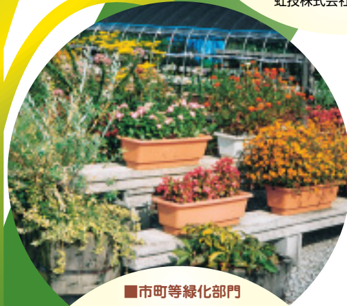
■市町等緑化部門 日高町花の基地 (日高町)