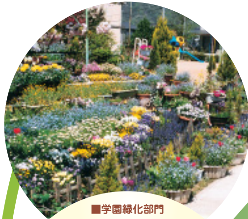
■学園緑化部門 八鹿町立宿南保育所 (八鹿町)