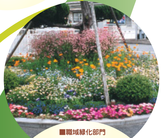
■職域緑化部門 虹技株式会社 (姫路市)