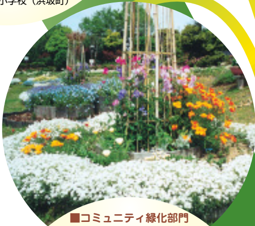
■コミュニティ緑化部門 ひまわりグループ (高砂市)