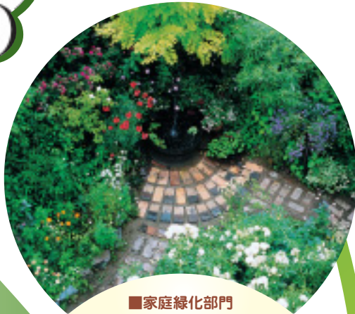
■家庭緑化部門 高嶋 清子 (三田市)