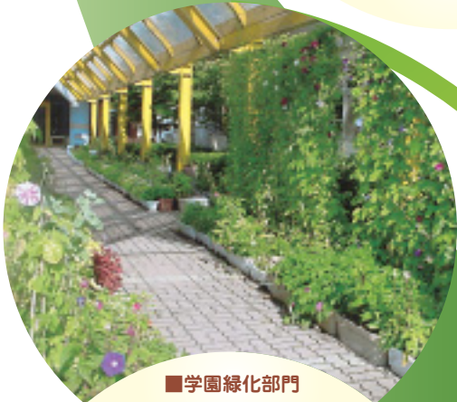
■学園緑化部門 浜坂町立浜坂小学校 (浜坂町)