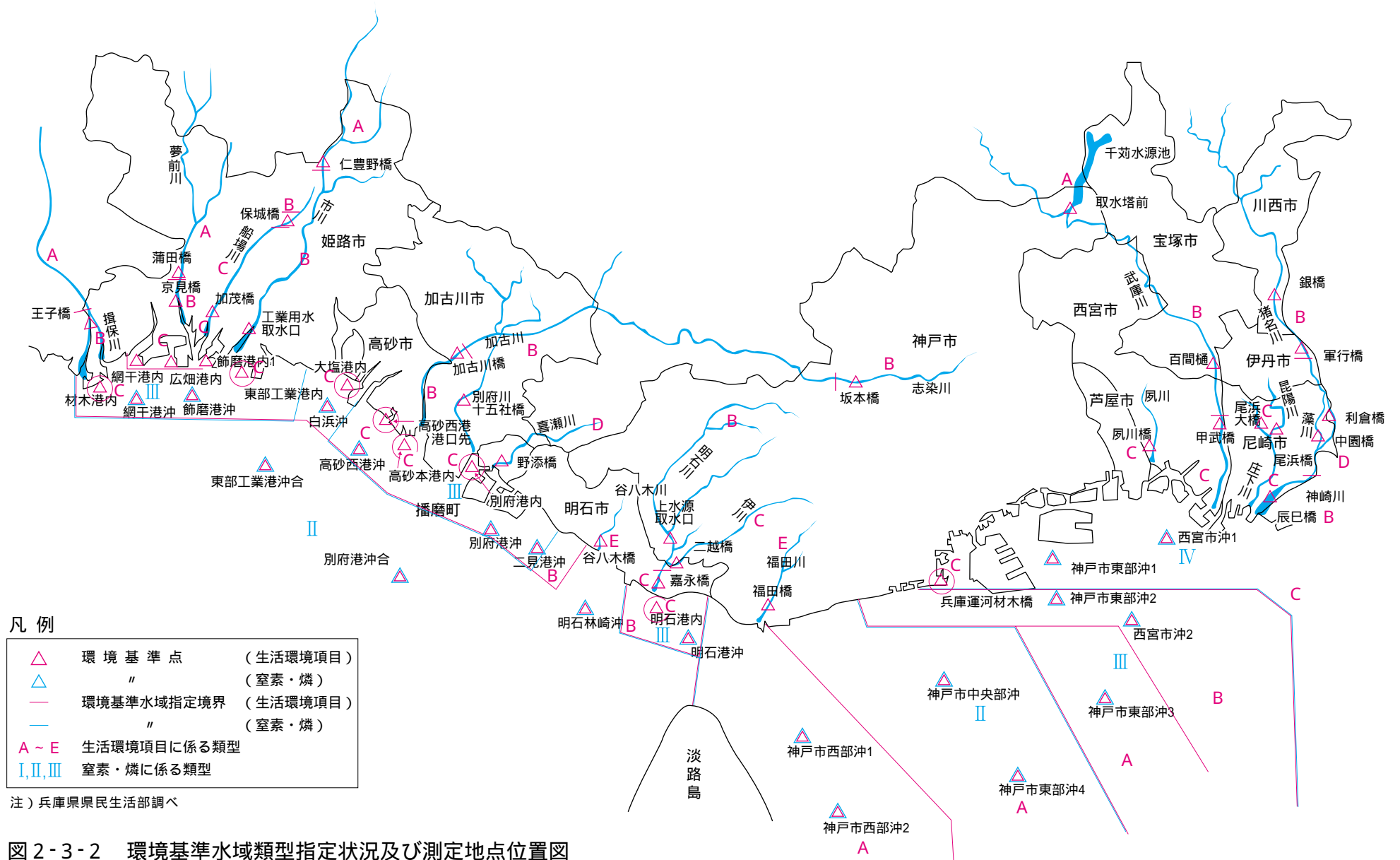
図 2-3-2 環境基準水域類型指定状況及び測定地点位置図 (平成 13 年 4 月 1 日現在)